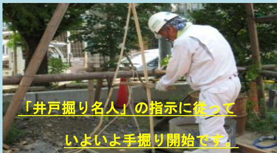
「井戸掘り名人」の指示に従って いよいよ手掘り開始です。