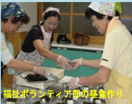
福祉ボランティア部の昼食作り