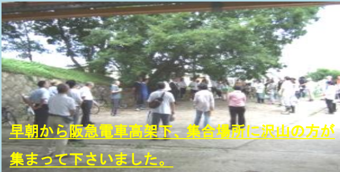
早朝から阪急電車高架下、集合場所に沢山の方が集まって下さいました。