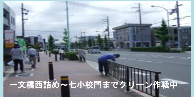
一文橋西詰め～七小校門までクリーン作戦中