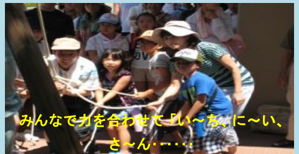
みんなで力を合わせて「い～ち、に～い、 さ～ん……」