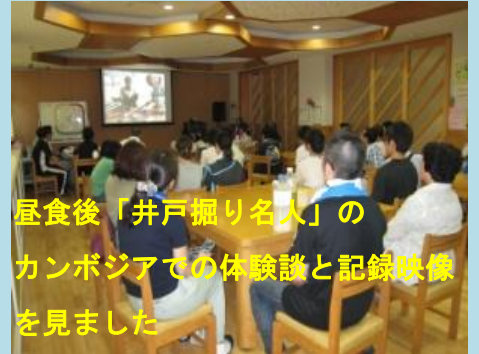
昼食後「井戸掘り名人」のカンボジアでの体験談と記録映像を見ました