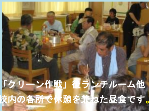
「クリーン作戦」後ランチルーム他校内の各所で休憩を兼ねた昼食です。